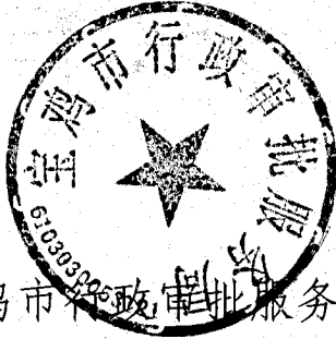
宝鸡市行政审批服务局