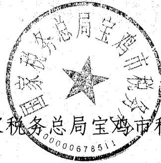
国家税务总局宝鸡市税务局